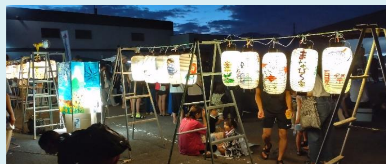
小学生作成の灯籠