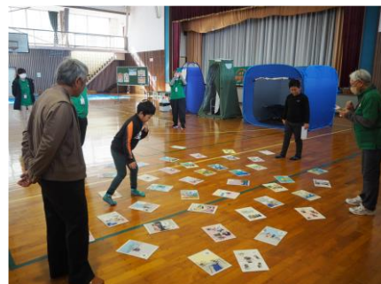
防災カルタでは体を使って防災学習

また、当日は日本防災士会新潟県支部の皆さんから楽しみながら防災について学習できるコーナーを展示しました。当日は保護者と子どもたちが様々な12のコーナーで防災について学習しました。