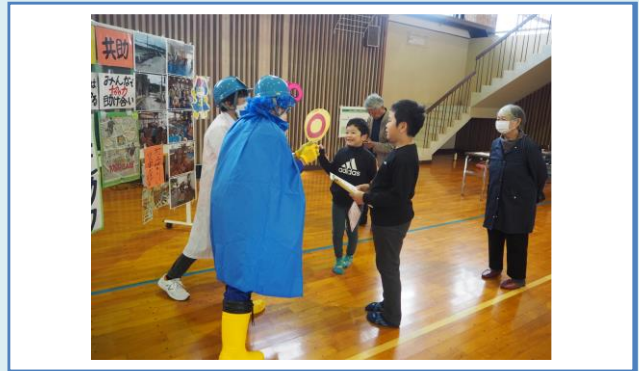
○×クイズでは頭をひねって防災学習

新穂体育館では「にいぼ」子ども防災体験教室が開催されました。会場では消防本部による消防車両の展示や救急救命体験、水消火器による消火体験も実施されました。