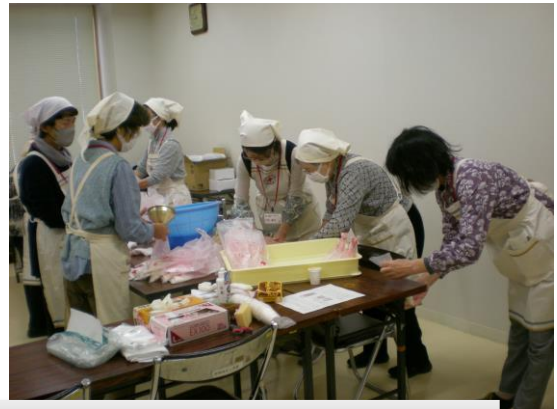
炊き出し訓練 100食分の炊飯準備

また、今年は4年ぶりに佐渡市赤十字奉仕団新穂班のみなさんのご協力により炊き出し訓練も実施しました。