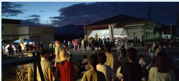
瓜生屋子供鬼太鼓

8月12日（日）地域の活性と新たな賑わいを作ることを目的とする「新穂しなしな盆踊り芸能ナイト」を開催しました。新穂地区の芸能を代表するのろま人形、春駒、新穂音頭、佐渡おけさ、鬼太鼓の芸能披露、小学生の絵付け灯籠が優しく光る中、商工会青年部、女性部などの出店、参加者からも盆踊り体験をしていただき、共に楽しめるイベントを行いました。