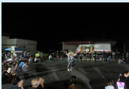
舟下鬼太鼓保存会